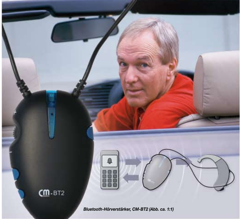
Bluetooth-Hörverstärker, CM-BT2 (Abb. ca. 1:1)

Musik hören am PC in Stereo? Ihr Navigationssystem spricht die Route direkt in Ihr Hörgerät? Noch mehr Komfort, noch besseres Verstehen beim mobilen Telefonieren? CM-BT2 – das ist zeitgemäße Bluetooth-Technologie plus intelligente audiologische Technik für entspanntes Hören und hervorragendes Verstehen.